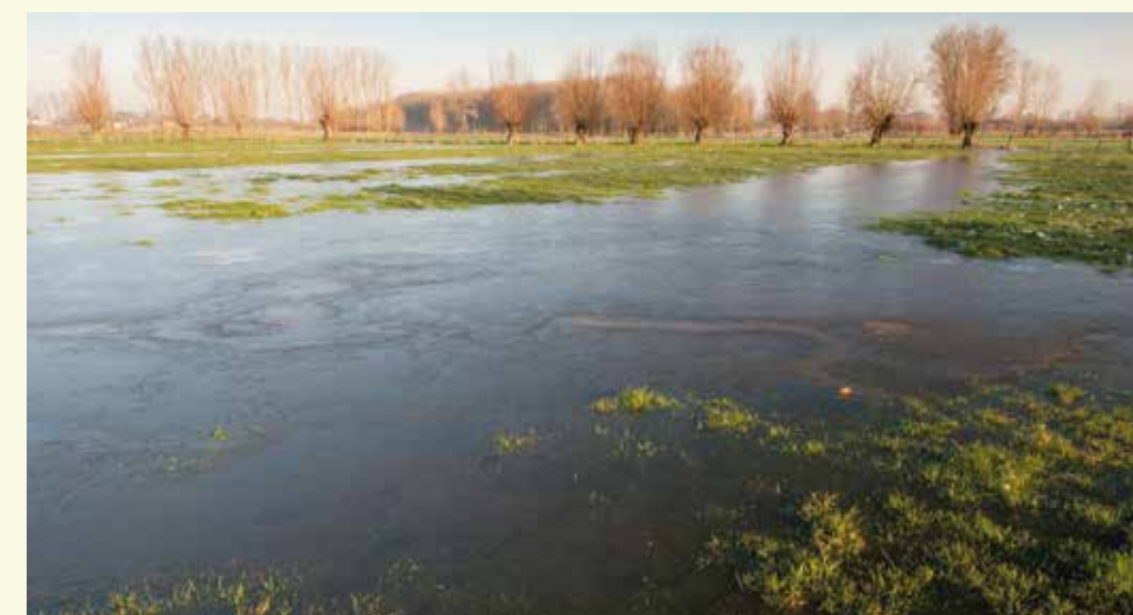
Vossenholse Meersen

De onverharde dreef loopt uit op de Grote Nieuwhofdreef die je links neemt. De naam van deze straat is genoemd naar het Nieuwhof dat je rechts voor je kan bewonderen ⑦. Het Nieuwhof dateert uit de tweede helft van de 18de eeuw en