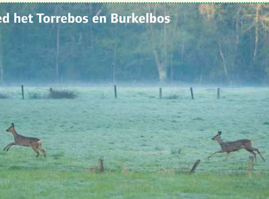
Reëen Drongengoed

Natuurpunt koopt en herstelt natuur, zodat iedereen ervan kan genieten. We maken van kleine, versnipperde bosjes zoals in dit wandelgebied één groot natuurgebied. Dat kan alleen dankzij jouw steun. Je ontvangt een fiscaal attest voor giften vanaf 40 euro, waarmee je ongeveer 30% van het gestorte bedrag terugkrijgt via je belastingen. Doe je gift op rekeningnummer BE56 2930 2120 7588 van Natuurpunt, Coxiestraat 11, 2800 Mechelen. Vergeet niet te vermelden 'gift projectnr. 6639 Torrebos'.