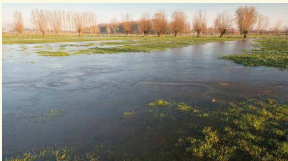
Vossenholse Meersen

De onverharde dreef loopt uit op de Grote Nieuwhofdreef die je links neemt. De naam van deze straat is genoemd naar het Nieuwhof dat je rechts voor je kan bewonderen 7 . Het Nieuwhof dateert uit de tweede helft van de 18de eeuw en