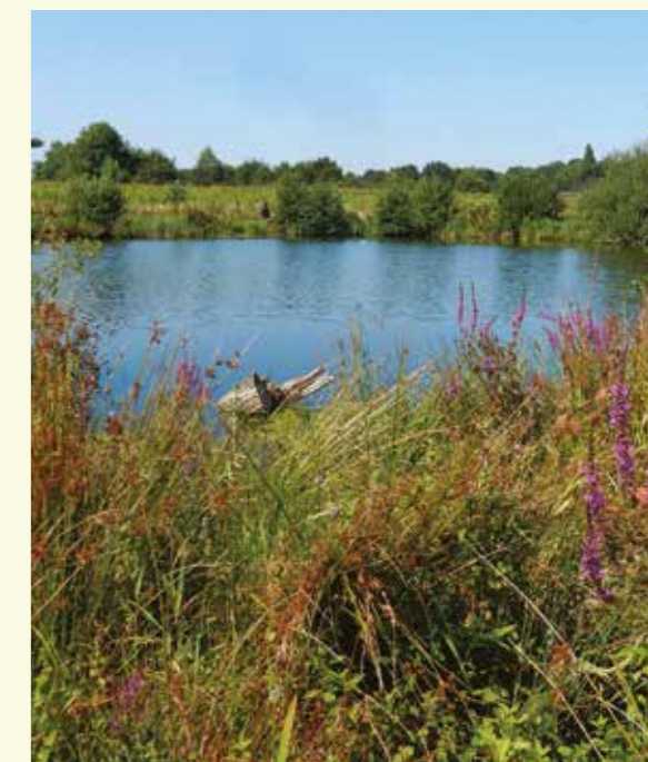
Stap even af voor een bezoek aan de Molenmeers

Het is een oude zandwinningsput van Waterwegen en Zeekanaal die sinds 1995 door Natuurpunt wordt beheerd. Er loopt een bewegwijzerd wandelpad (rode Natuurpunt-pijltjes) rondom de plas. De wandeling wordt binnenkort zelfs nog uitgebreid naar de achterliggende Zuurhoek, een nog grotere plas met een vogelkijkhut.