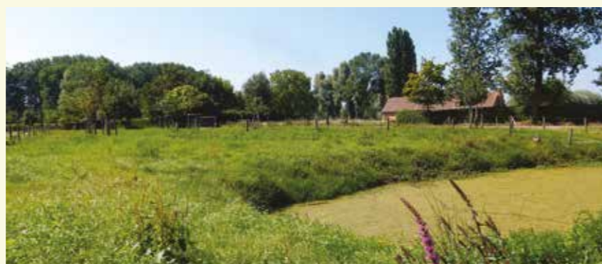
In ere hersteld Driesselken

Landmaatschappij) en die een mooie hoogstamboomgaard, veedrinkpoel en rustbank cadeau heeft gekregen.