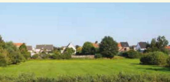
Priesteragemeers, educatief natuurgebied in Landegem

Tussen de brug over de E40 en Landegemdorp zie je op de rechterkant het educatief natuurgebied Priesteragemeers, beheerd door Natuurpunt De Ratel Nevele. Het gebied is toegankelijk vanaf het dorp.