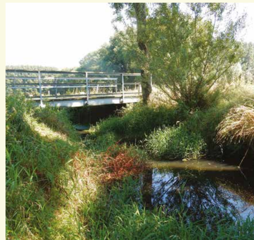
Eén van de brugges over de Kale

Vanaf knooppunt 47 neem je een nieuw aangelegd, onverhard fietspad naar knooppunt 48 . Je rijdt er onder meer over een nieuw brugje over de Oude Kale... een landschappelijk erg mooi stukje fietsplezier! In dit gebied zijn Natuurpunt De Ratel Nevele en Natuurpunt Lovendegem samen actief en beheren ze verschillende hooilanden in samenwerking met bioboerderij De Zwaluw uit Lovendegem.