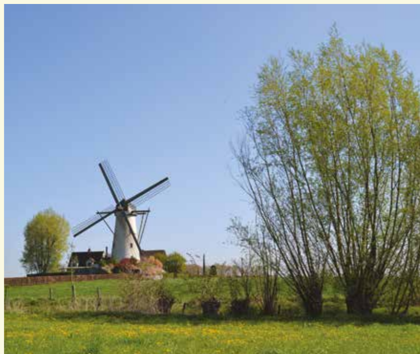
De Van Vlaenderensmolen is prominent aanwezig in het landschap