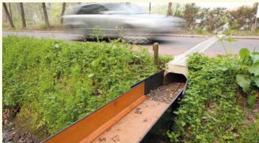
Amfibieëntunnel in de Lotenhullestraat

De Kraenepoel is de laatste van de tientallen vijvers waarmee in de middeleeuwen het Bulskampveld bezaaid was. Tot na de Tweede Wereldoorlog bleef hij in gebruik als visteeltvijver, waardoor zich een merkwaardige flora kon ontwikkelen die goed leek op die van de Kempense vennen. Maar als gevolg van een slechte waterkwaliteit verdwenen veel van de bijzondere soorten. De voorbije jaren werden al heel wat initiatieven genomen om de waardevolle vijver te herstellen. Zeldzame soorten zoals moerashertshooi, pilvaren, naaldwaterbies en gesteeld glaskroos kwamen terug of breidden zich uit. De waterkwaliteit blijft echter onvoldoende om deze