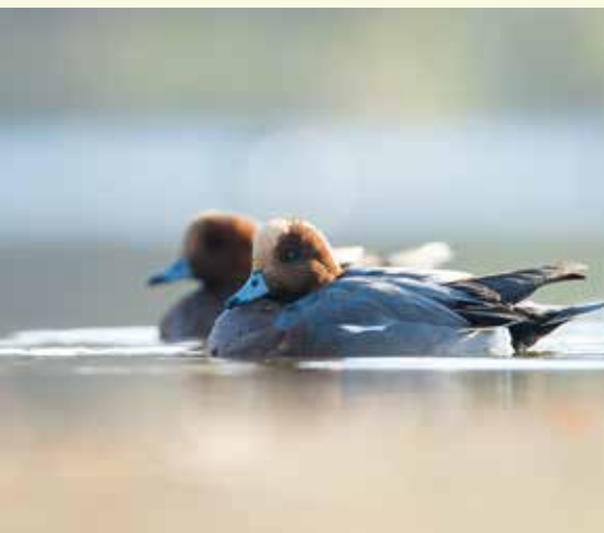
Je herkent de smient aan de korte, grijze snavel. De mannetjes hebben een rode kop met gelige vlek tussen de ogen. Men noemt ze ook wel 'fluiteend' omwille van hun 'pieuw' roep.

De brug over laat je twee straatjes (Bosvijverdreef en Kraenepoelpad) links liggen. Je bereikt al snel de Kraenepoel. Een goede mogelijkheid om van de Kraenepoel te genieten is het wandelpad links nemen (voorbij het klappoortje). Na een goeie 100 meter bereik je een kijkwand met zicht op de Kraenepoel. ③