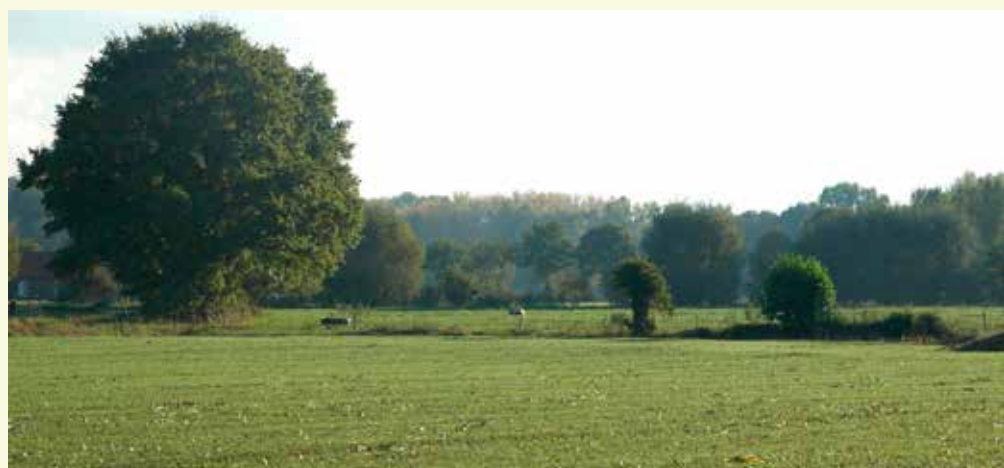
Een mooi stukje landschap vlakbij de Markettebossen

4 Je ziet enkele tunneltjes onder de weg om padden tijdens hun trek na de winterslaap veilig naar deze vijver te leiden en omgekeerd. Aan je rechterkant