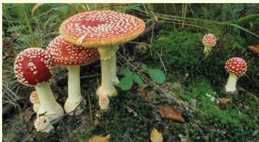
Het Bellebargiebos is gekend voor de paddenstoelen

GPS: 51°10'49.72"N 3°38'27.13"O De Trigelstraat is bereikbaar via de Eeklostraat en de Gravin d'Alcantaralaan.