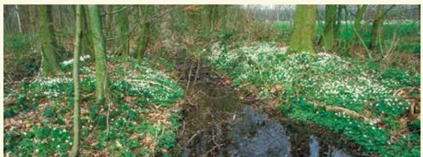
Bellebargiebos in het voorjaar: een tapijt van bosanemonen

het Agentschap voor Natuur en Bos. Het bos is prachtig in de herfst en is gekend omwille van de paddenstoelenrijkdom. In het voorjaar vind je er ook soorten zoals dalkruid, salomonzegel en bosanemoon.