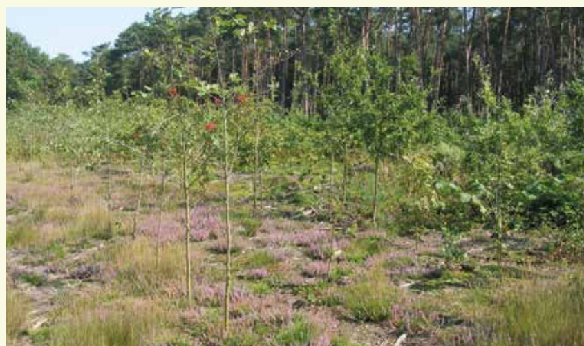
Het naaldhout wordt geleidelijk aan omgevormd naar loofhout, hier en daar komt struikheide tevoorschijn