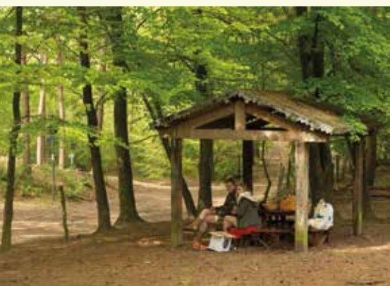
Het kaartershuisje

Aan 34 zie je het 'kaartershuisje', een begrip voor de Lembeekse Bossen. Het is een rust- en ontmoetingsplek voor iedereen die hier komt. Heb je kinderen mee? Pik dan even het avonturenparcours in het speelbos mee. Het parcours start tegenover het kaartershuisje.