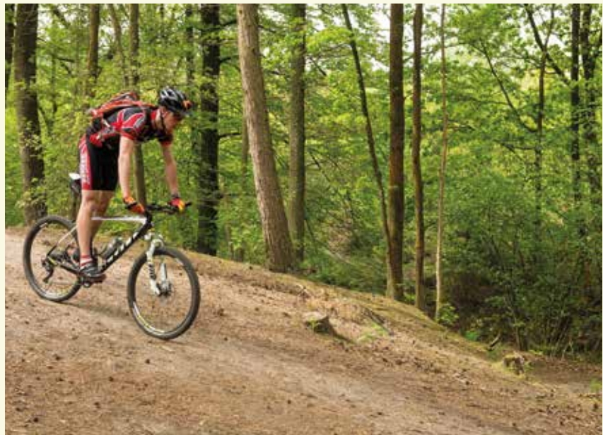
De Lembeekse Bossen zijn ook bij mountainbikers en ruiters erg geliefd