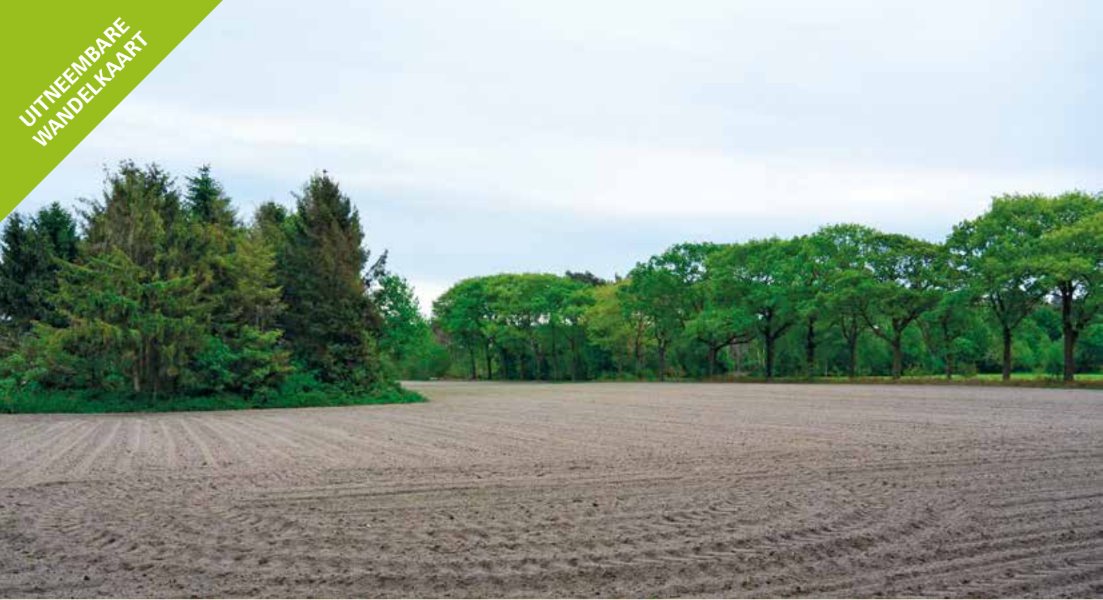
Het Scheutbos ligt tussen weilanden en akkers

Vorbij 26 wandel je het Bellebargiebos uit richting 19. Het open landschap in de Hoge Zandweg geeft je aan je rechterkant zicht op het Scheutbos. Dit bos heeft sinds 1961 als bestemming 'woonparkgebied', dat bebouwing onder bepaalde voorwaarden toelaat. Deze kant van het bos is nog vrij intact, maar als je verder gaat lang 18 (let op de fraaie houtkanten langs de Magermansdreef) en bij 29 aan komt, zie je dat het bos bijna volledig is verkaveld. Natuurpunt en Partners Meetjesland ijvert sinds 2000 voor het behoud van dit bos, dat een grote ecologische waarde heeft (onder meer de zwarte specht werd hier al gespot) en een stapsteen is tussen Het Leen en de Lembeekse Bossen. Bovendien valt het verkavelen van dit bos voor villa's niet te verantwoorden. Het zou mooi zijn mochten de Lembeekse Bossen, het Scheutbos en Het Leen ooit met elkaar verbonden worden via het Scheutbos.