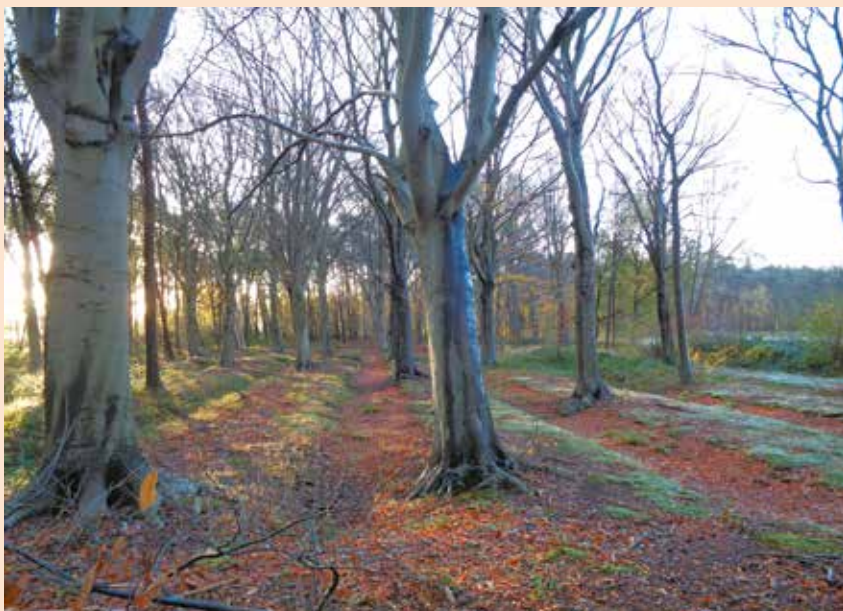
Het Eikenbos, een prachtig oud bos met eiken en beuken

Een aankoop om U tegen te zeggen, dat is het Eikenbos. Het is één van de pareltjes binnen het zoekgebied voor natuurgebied de Keigatbossen die te wachten liggen op een betere toekomst. Het terrein van ruim 9 hectare werd onlangs eigendom van Natuurpunt. Natuurpunt Zomergem neemt het beheer op zich, een bijkomende uitdaging naast de drie andere terreinen in het Keigatbos die de afdeling al in beheer heeft.