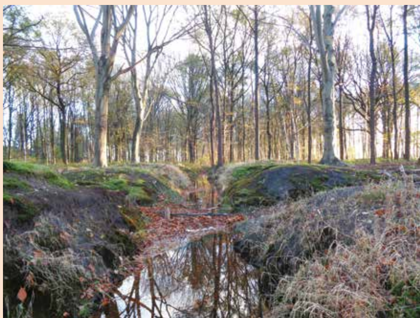
Dankzij de rabatten kon men hier ooit bomen planten

Natuurpunt streeft naar een groot bosgebied dat zuurstof geeft aan de omgeving. Daarom is elke gift belangrijk, hoe klein ook. Kleine eindjes natuur aan elkaar knopen, daar gaat het ons om! Voor een gift vanaf 40 euro ontvang je een fiscaal attest. Overschrijven kan op rekeningnummer BE56 2930 2120 7588 van Natuurpunt Beheer, Coxiestraat 11, 2800 Mechelen, met vermelding van 'projectnr. 6684 Keigatbos'.