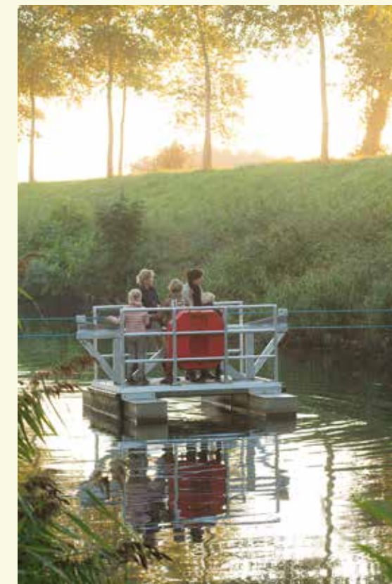
Met het voetveer geraak je het Leopoldkanaal over, een leuke ervaring voor jong en oud

verder aftakelde. Hoewel het gebouw in 1986 beschermd werd als monument, duurde het nog jarenlang voordat er geld en een doel was voor het gebouw. Het werd na de restauratie uitgebaut als congres- en feestzaal, restaurant en wellnessruimte, maar in 2018 werden deze activiteiten stopgezet.