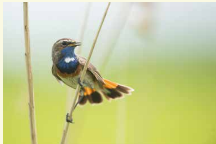
De blauwborst broedt graag op plekken met brede rietkragen

Op dit begraasd stuk loop je op de bedding van de Eeklose Watergang. Die lag er al voor het kanaal gegraven is: van in de dertiende eeuw. Gravin Johanna van Constantinopel verkocht toen op grote schaal veengronden uit het Moer (moeras) van Aardenburg, waartoe ook Sint-Laureins behoorde, om de ontginning van het gebied te stimuleren.