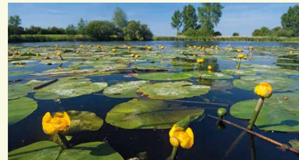
Gele plomp is sinds het herstel van de Vrouwkeshoekkreek een vaste waarde in het kreekwater

had het de aanblik van bijvoorbeeld het Verdrongen Land van Saeftinghe of Het Zwin, waar de getijden voelbaar waren. In de dertiende eeuw werd het gebied omgezet naar cultuurland. Dorpjes en gehuchten ontstonden. In 1375 echter zorgde een hevige storm voor overstromingen, waardoor heel wat dorpen van de kaart werden geveegd. Roeselare of Nieuw-Roeselare, een stadje in de buurt waar nu de Roeselarekreek ligt, is één van de bekendste voorbeelden.