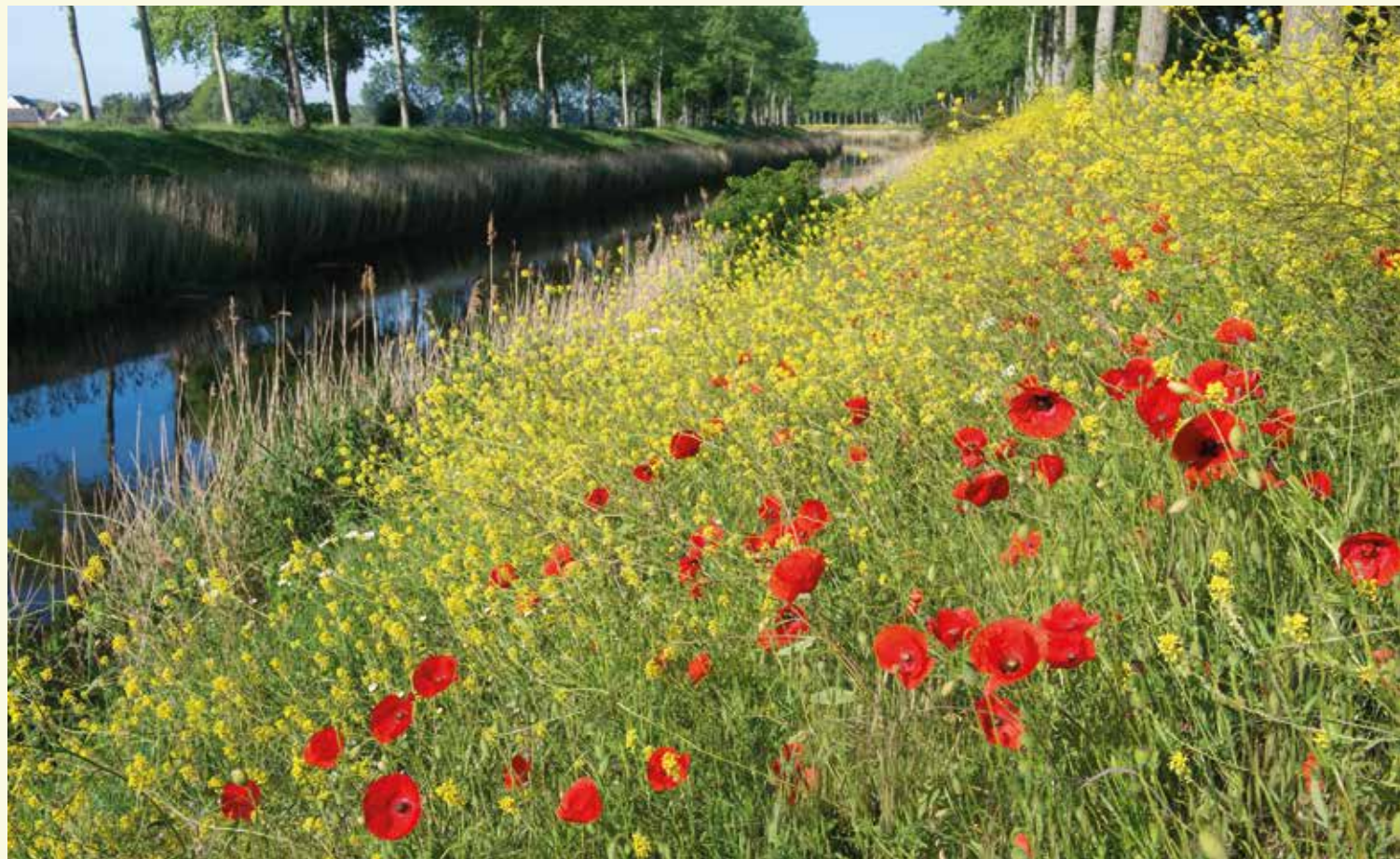
Bloemrijke berm langs het Leopoldkanael