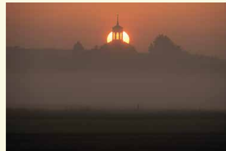
De toren van het Godshuis, zichtbaar van in de polders

Hier ga je linksaf. Voor je zie je de kerk van Sint-Laureins en ook de toren van het Godshuis, dat in 1849 het licht zag en op die korte tijd al een bewogen geschiedenis kent. Opggericht als klooster en ziekenhuis werden er armen, wezen en ouderen verzorgd. In de jaren 1960 verlieten de zusters van de kloosterorde Kindsheid Jesu het aftakelende gebouw, dat vervolgens