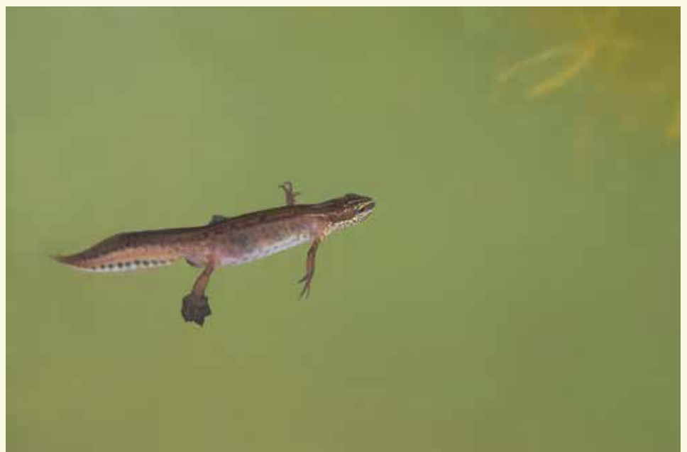
De vinpootsalamander krijgt kansen in de nieuwe poelen

Voor het beheer van de omliggende graslanden werkt Natuurpunt samen met enkel lokale landbouwers. De natuur krijgt hier kansen in de nieuw gegraven poelen en depressies. Voor soorten zoals de vinpootsalamander is dit zeer belangrijk. Dit is de kleinste watersalamander in Vlaanderen. De soort verkiest vooral waterpartijen (poelen, karrensproten, vennen, vijvers, bronnen) in bossen of aan de rand ervan. In Oost- en West-Vlaanderen is de vinpootsalamander zeldzaam geworden. De nieuwe poelen zijn belangrijk om deze soort in De Vaanders duurzame levenskansen geven. Een eind verder kom je aan de Zouterbeek-Galgeveldbeek. In deze beek is er een sterke rietgroei.