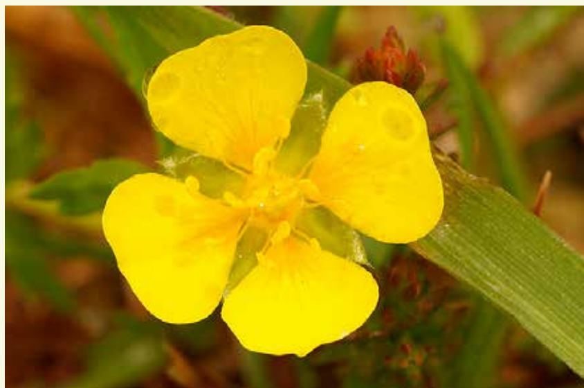
Voor tormentil moet je in de dreven op zoek naar lichtgele bloemetjes

Je stapt nu door een bosrijke zone. De percelen zijn hier minder nat, ideaal voor zuur eikenbos. Dit zijn bossen van droge tot vochtige, voedselarme bodems op voornamelijk zandgronden. We vinden er vooral zomereik en berk. Maar meerdere percelen bevatten ook Amerikaanse eiken. Dit is een minder gewenste soort. Een mooie boom, dat wel, maar qua natuurwaarde gooit hij geen hoge ogen. In en om een zomereik leven ongeveer 450 insectensoorten, bij de Amerikaanse eik tellen we er slechts dertien. Natuurpunt zal op termijn dan ook streven naar een omvormingsbeheer, waarbij de exoten stap voor stap verwijderd worden ten voordele van inheemse soorten.