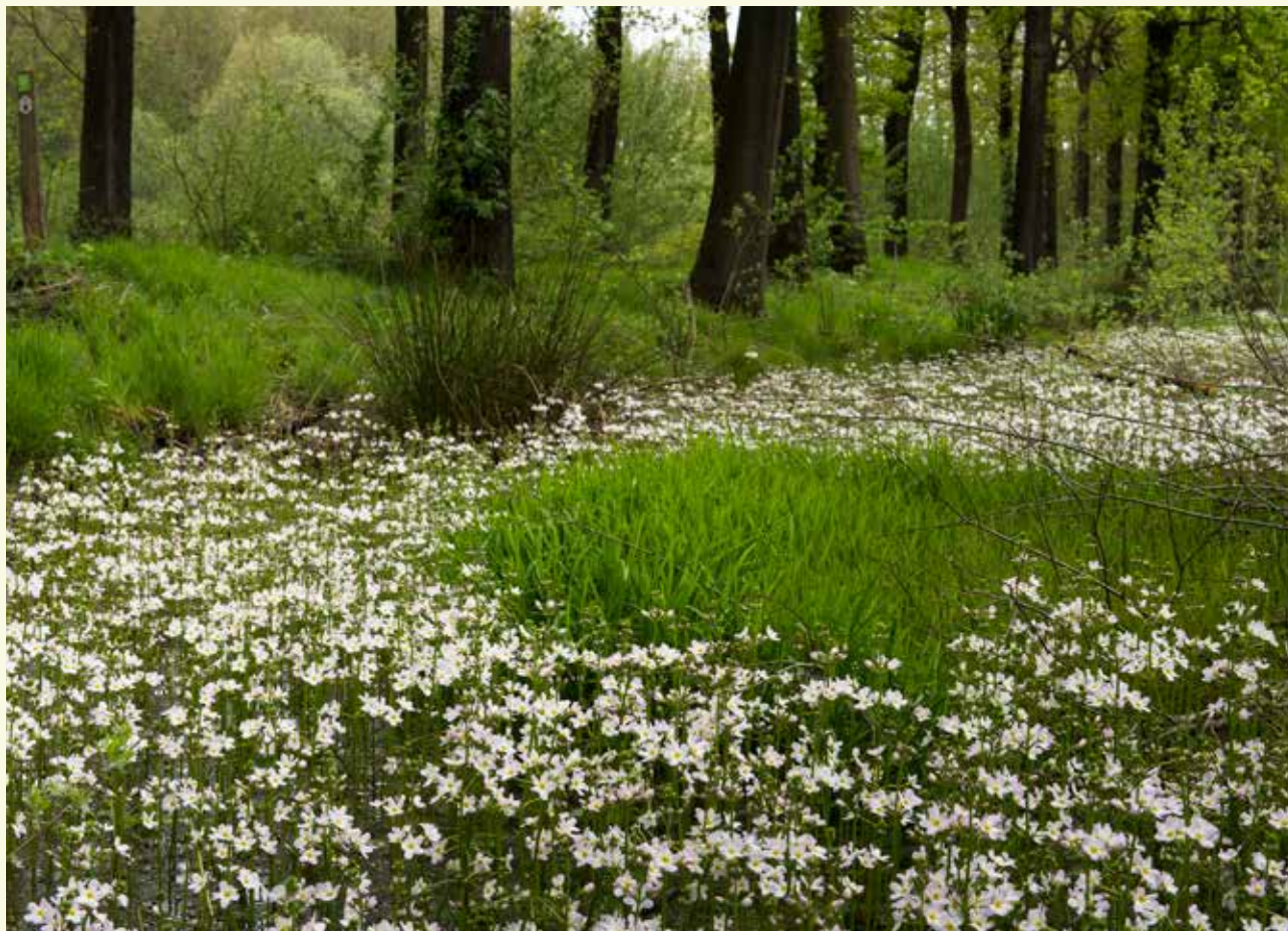
Waterviolier groeit met prachtige, fijne bloemetjes op het water en is een typische soort voor kwelwater

Je stapt langs deze waterloop tot aan de spoorweg. Als je verderop links afslaat, weg van de spoorweg, vind je aan je linkerzijde een zeer nat wilgenstruwelenbos. In de ondergroei staan soorten typisch voor deze natte bossen zoals moeraszegge, zompzegge en ijle zegge.