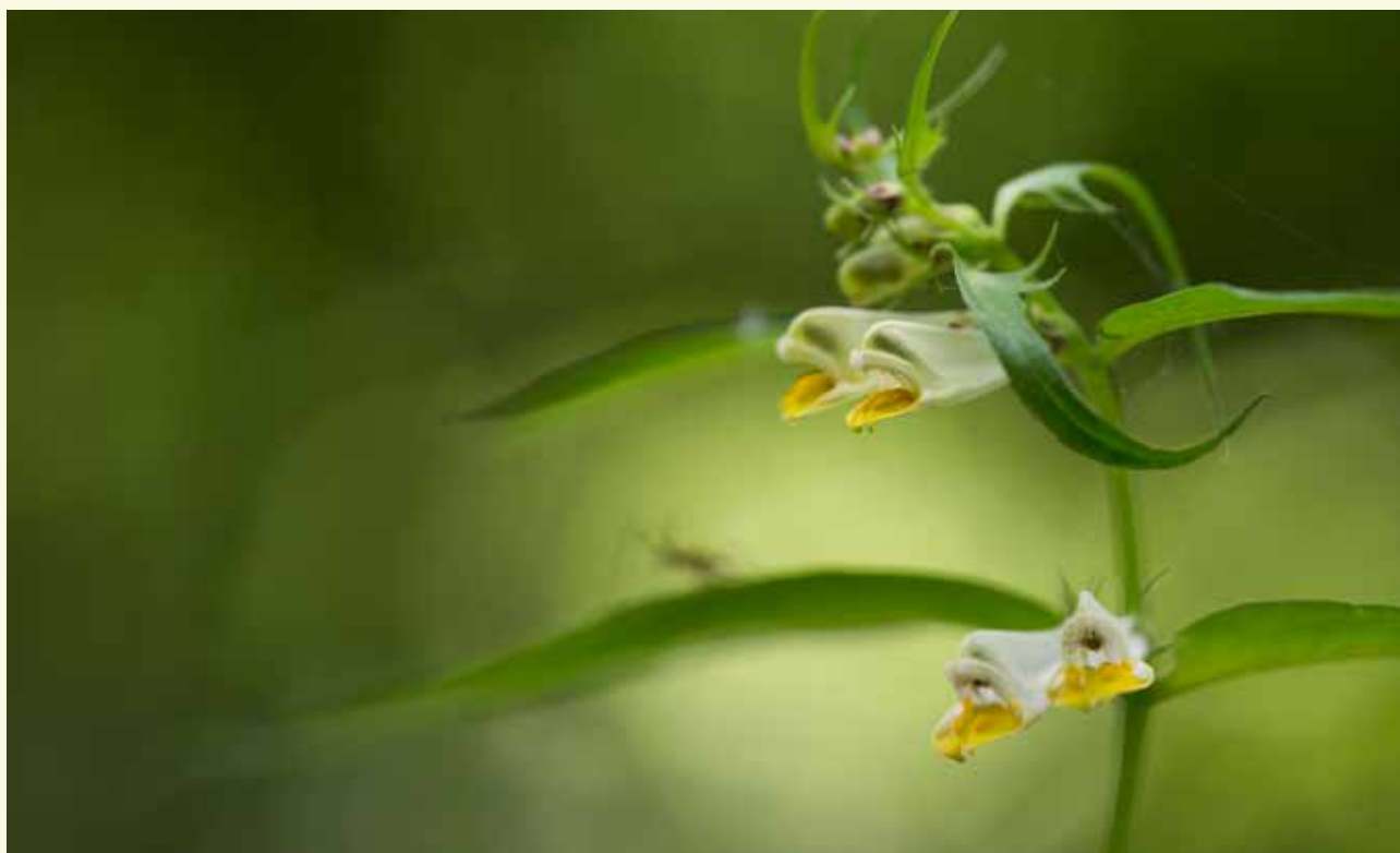
Hengel, een zeldzame plant die je in De Vaanders kan bewonderen