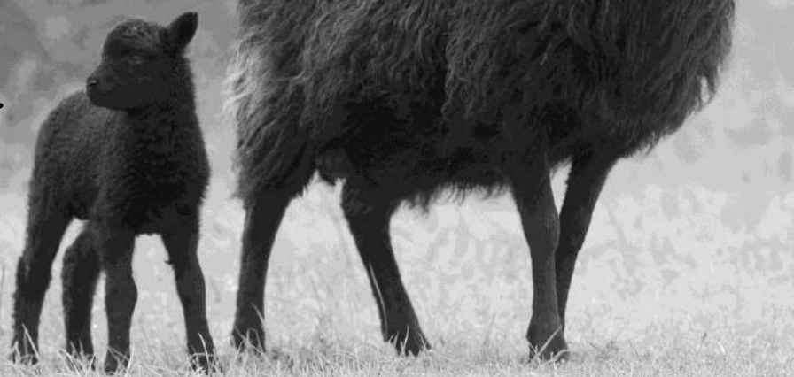
Hebridean moeder met lam