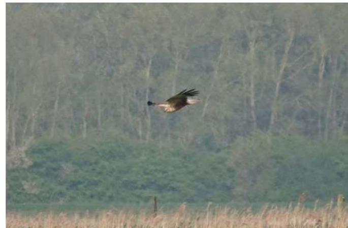
jagende bruine kiekendief